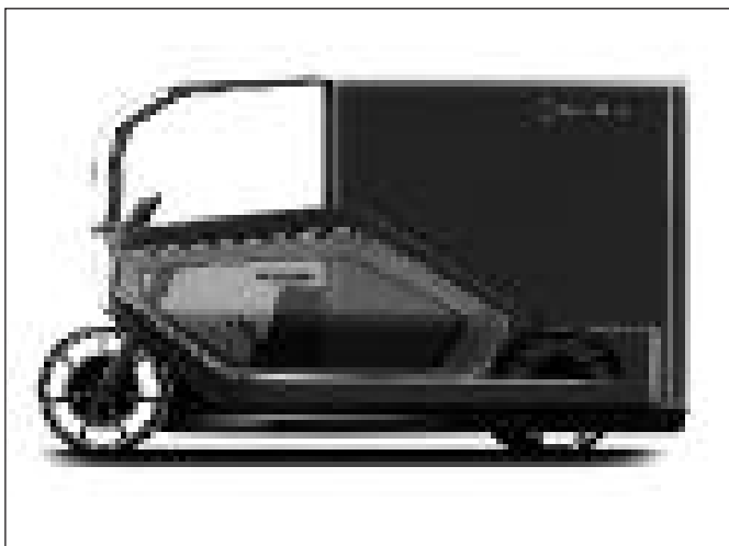
E-Cargo der Tretbox GmbH 2017

Diese Fahrzeuge werden drei Räder haben, einen Container als Anhänger und können bis zu 200 Kilogramm zu-laden.