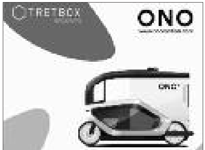
Tretbox wird zu Ono – Webauftritt 2018