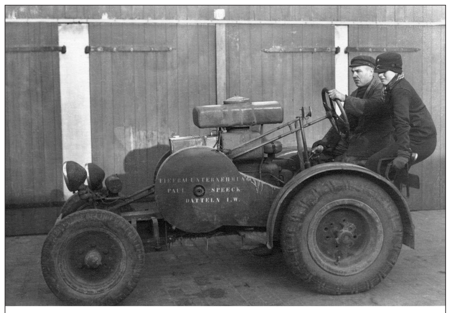
Ein Hagedorn-Schlepper im Dienst eines Bauunternehmers