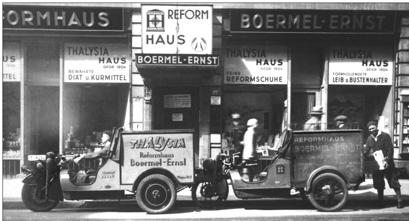
Heute noch existiert dieses Reformhaus in Frankfurt/Main, hier etwa 1927 mit eigenen Dick-Transportern