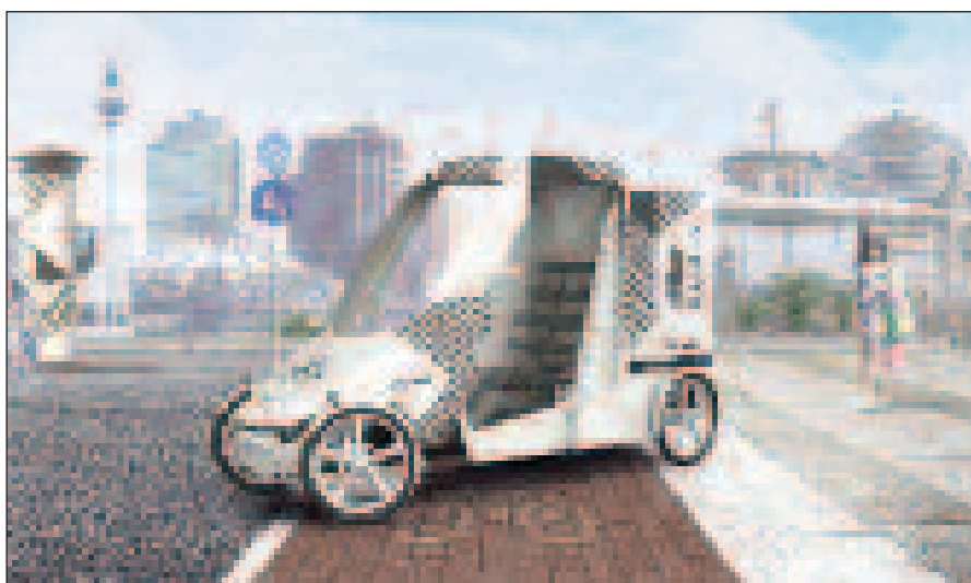
Citkar 2018 aus dem Webauftritt